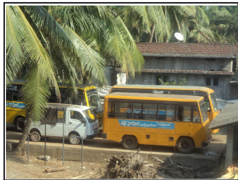
స్కూల్ రవాణా బస్సులు