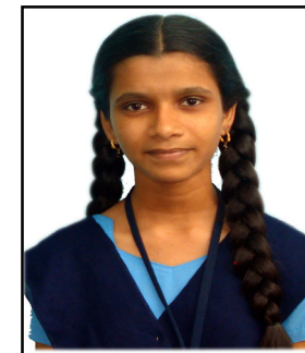
8వ.తరగతి బి.మహిమ - 75%