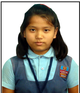
6వ.తరగతి ఆర్. సీమ - 70%