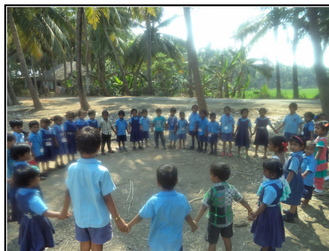
A.Y. High School Play Ground