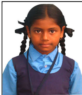
2వ.తరగతి పి. కీర్తన - 92%