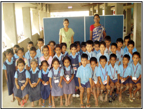
ఎల్.కె.జి. క్లాస్ టీచర్ మరియు హెల్పర్