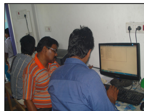
Computer Lab with Broadband internet connection and 24hrs power supply inverter, AC also