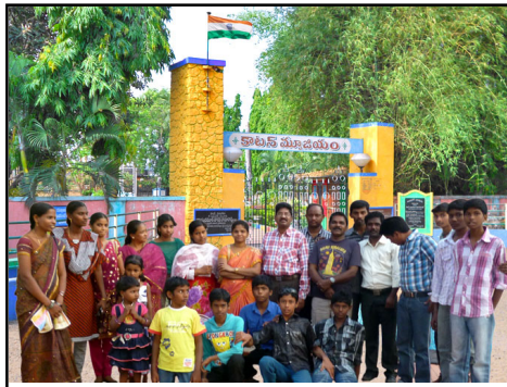
Sir Arthur Cotton Engineering Museum in Rajahmundry