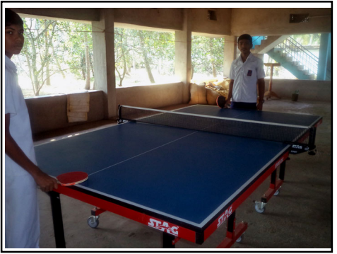
ఆధునికంగా 30వేలు రూపాయతో కొన్న టేబుల్ టెన్నిస్ బోర్డు