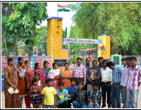
సర్.ఆర్థర్ కాటన్ ఇంజనీరింగ్ మ్యూజియం.రాజమండ్రి