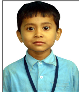
ఎల్.కె.జి. ఆర్. యశాద - 96%