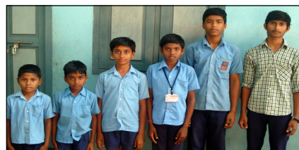
ఆగష్టు 2013 అగ్గెటిక్స్ విజేతలు