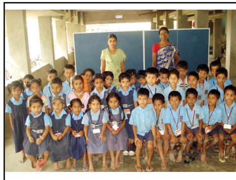
L.K.G. Class with Teacher and Helper