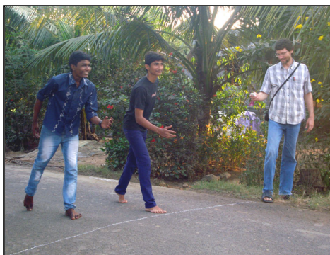
Athletics 40mtr. dash