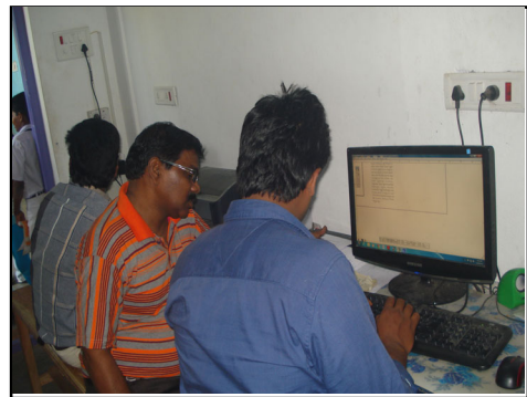
ఇన్వర్టర్ మరియు ఇంటర్నెట్ సదుపాయం కలిగిన ఎ.సి. కంప్యూటర్ రూమ్.