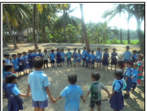
ఎ.వై.స్కూల్ ఆట స్థలం