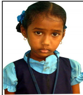
నర్సరీ ఎన్.హరిత - 92%