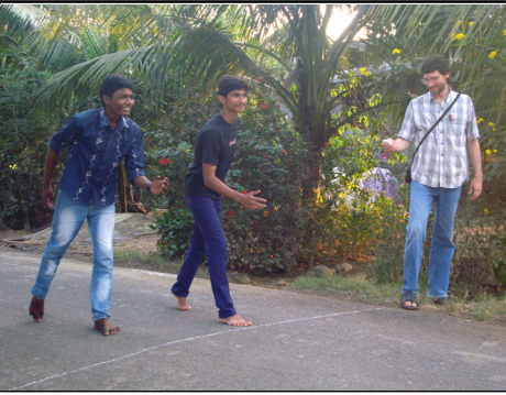
40 మీటర్ల పరుగు పంథెం