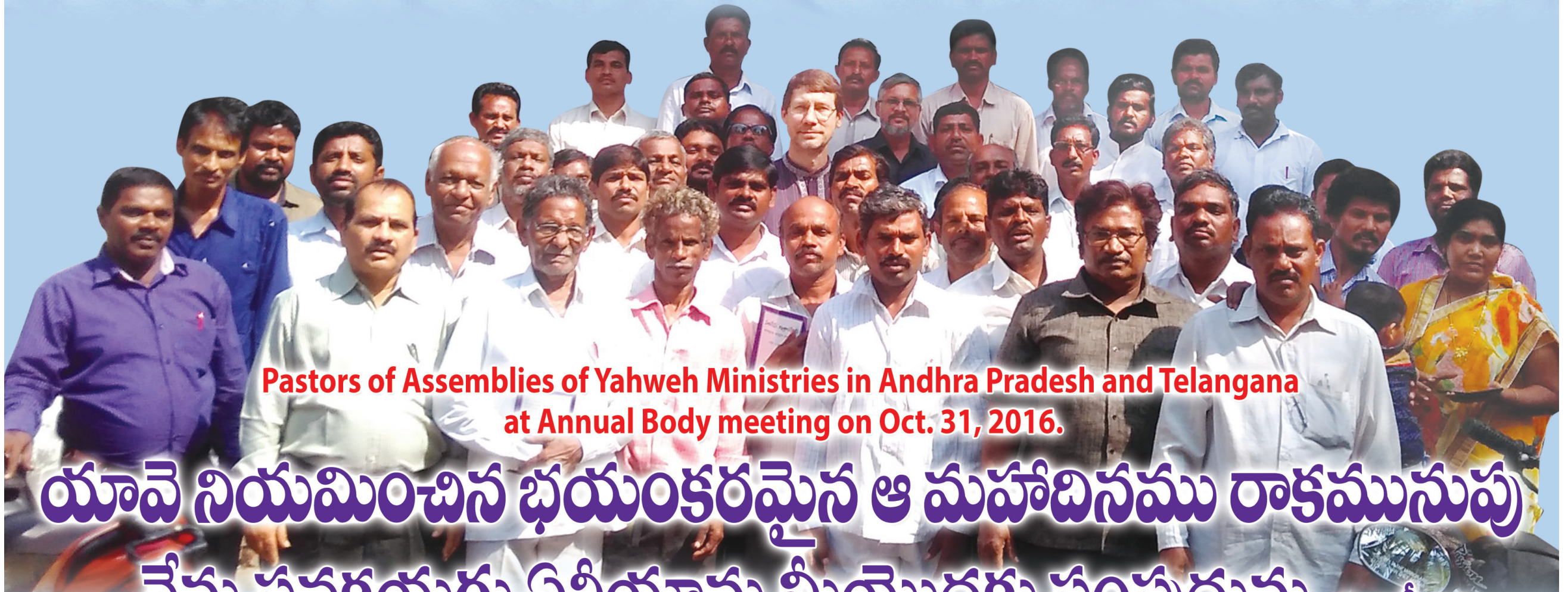
Pastors of Assemblies of Yahweh Ministries in Andhra Pradesh and Telangana at Annual Body meeting on Oct. 31, 2016.

Behold, I am sending you Elijah ha navi (the prophet) before the great and dreadful day of Yahweh . Malachi 4:5